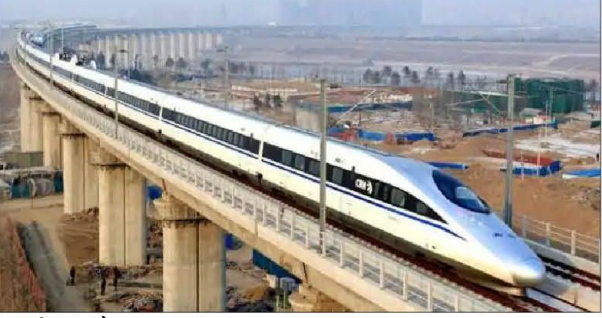
केंद्र और राज्य सरकार इस परियोजना को मंजूरी दे चुकी है। इससे एनसीआर के लोगों को जहां सर्वाजनिक परिवहन की बेहतर सुविधा मिलेगी, वहीं एनसीआर में भविष्य में बढ़ते वाहनों के दबाव से मुक्ति मिलेगी। आरआरटीएस रेल अधीनत हाई स्पीड ट्रेन है। इसकी डिजाइन गति 180 किमी प्रति घंटा और औसत गति 100 किमी प्रति घंटा है। यह मेट्रो रेल से तीन गुना अधिक तेजी से चलेगी। परियोजना से व्यापक आर्थिक लाभ मिलेगा, जैसे श्रम व उद्योग से उत्पादन में सुधार होगा।

महालक्ष्मी व्यरो नई दिल्ली, 05 सितम्बर दिल्ली, गाजियाबाद व मेरठ के बीच तेज गति से चलने वाली रीजनल रैपिड रेल ट्रांजिट सिस्टम (आरआरटीएस) परियोजना में केंद्र और यूपी के बीच होने वाले मेमोरैंडम ऑफ एंजमेंट (एमओयू) को शुक्रवार को कैबिनेट बाईं सकुलेशन मंजूरी दे दी गई। आवास विभाग के अधिकारी इस पर अब हस्ताक्षर कर केंद्र सरकार को भेजेंगे। मुख्यमंत्री योगी आदित्यनाथ द्वारा एमओयू को दी गई मंजूरी के मुताबिक राष्ट्रीय राजधानी क्षेत्र (एनसीआर) के लोगों की सुविधाओं के लिए इसे चलाया जाएगा। इससे जहां भीड़-भाड़ व प्रदूषण कम होगा, शिक्षा, स्वास्थ्य व रोजगार के अवसरों तक लोगों की पहुंच बढ़ाने में मदद मिलेगी। दिल्ली, गाजियाबाद व मेरठ के बीच आरआरटीएस परियोजना की कुल लागत 30274 करोड़ रुपये है। इसमें केंद्र सरकार 5872 करोड़, दिल्ली सरकार 1180 करोड़ और यूपी सरकार 6048 करोड़ रुपये देगी।