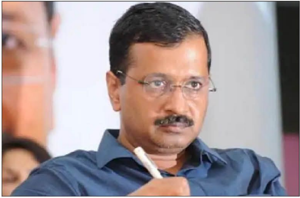
कहा गया कि मुख्यमंत्री ने आश्वासन दिया कि राहत प्रदान करने के लिए पर्याप्त कदम उठाए जाएंगे। दिल्ली में बिजली के गैर-घरेलू और औद्योगिक उपभोक्ताओं को मासिक स्थिर शुल्क के रूप में 250 रुपये प्रति केवीए का भुगतान करना पड़ता है। केजरीवाल ने व्यापारियों और उद्योग संघ के प्रतिनिधियों को बताया कि कोरोना वायरस महामारी के

महालक्ष्मी व्यरो नई दिल्ली, 05 सितम्बर दिल्ली के मुख्यमंत्री अरविंद केजरीवाल ने व्यापारियों और उद्योगपतियों को आश्वासन दिया है कि कोविड-19 महामारी को देखते हुए निर्धारित बिजली शुल्क से राहत देने के लिए कदम उठाए जाएंगे। दिल्ली सरकार की ओर से शुक्रवार को जारी एक आधिकारिक बयान में इसकी जानकारी देते हुए कहा गया है कि शहर के व्यापारी और उद्योगपति स्थायी शुल्क से राहत की मांग कर रहे हैं। उनका कहना है कि महामारी के कारण उनकी दुकानों और कारखाने बंद थे। इस कारण उन्हें नुकसान उठाना पड़ा है। दिल्ली सरकार के एक बयान में