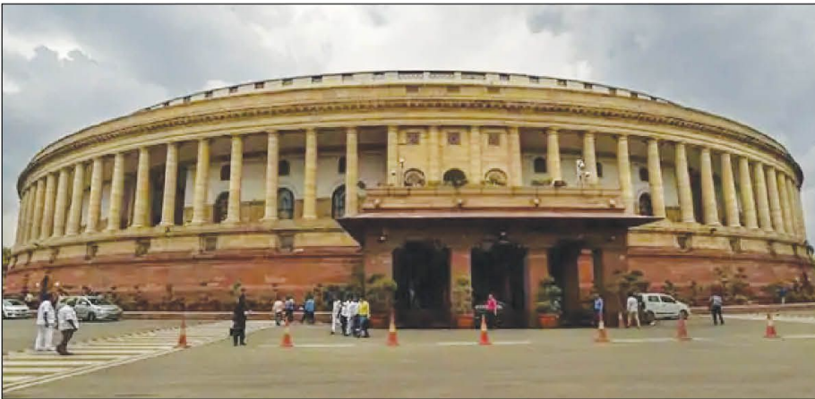
सभी प्रमुख विपक्षी दलों से बात की है और इस चर्चा में केवल एक क्षेत्रीय पार्टी को छोड़कर अधिकांश दलों ने प्रश्नकाल स्थगन और सदस्यों के

का जवाब देने के लिए बाध्य नहीं होती है। जबकि प्रश्नकाल में सरकार को पहले से पूरी तैयारी करनी होती है। इसलिए सरकार ने प्रश्नकाल को स्थगित करने का फैसला किया है। राज्यसभा के सत्रों के अनुसार, मानसून सत्र के दौरान हर रोज 160 अतारकित सवालों के लिखित जवाब दिए जाएंगे और यह संख्या हर सप्ताह 1120 सवालों की होगी। इसके साथ ही रोजाना 10 विशेष और 10 शूकाल के उल्लेख लिए जाएंगे। साथ ही सत्र के दौरान अल्पकालिक चर्चाएँ और महत्वपूर्ण मुद्दों पर चर्चा भी होगी। विधेयक व विभिन्न मुद्दों पर विषय वोटिंग भी करा सकेगा। सत्रों के अनुसार सत्र के पूर्व रक्षामंत्री और संसदीय कार्यमंत्री ने